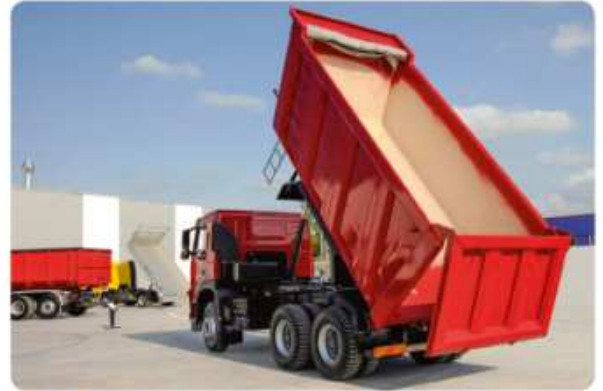
DOC 2 Dimension de la benne du camion (en mètres) : longueur : 7 ; largeur : 3 ; hauteur : 3,5.